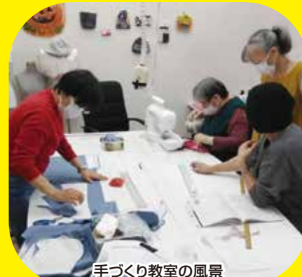
手づくり教室の風景