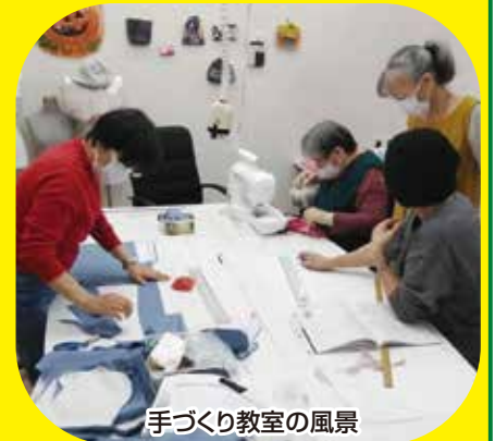
手づくり教室の風景